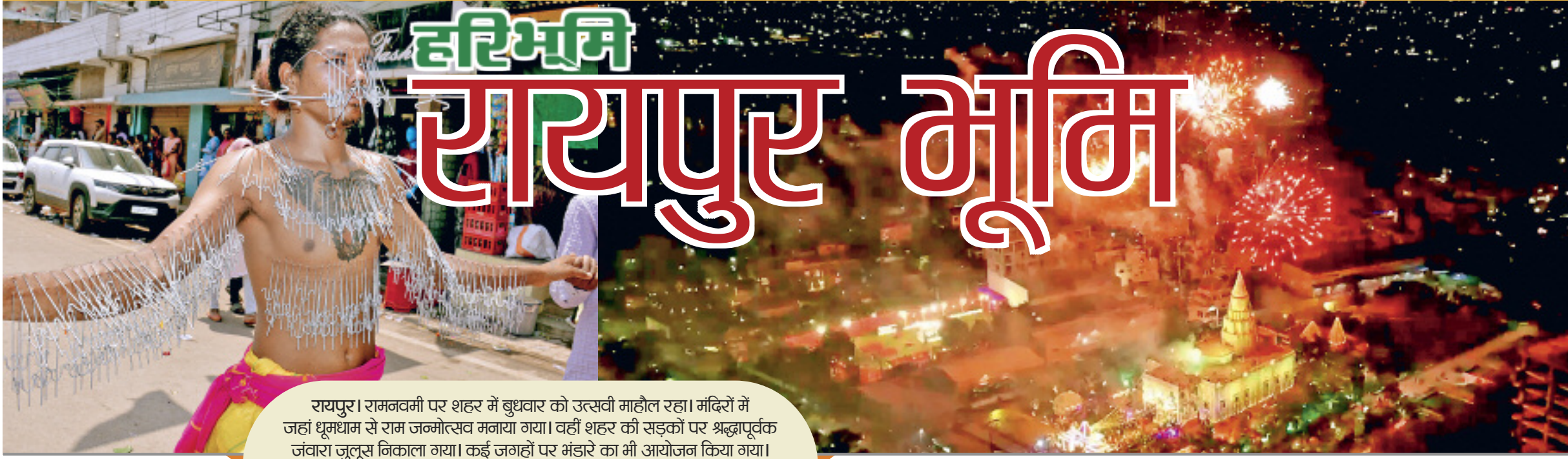
रायपुर। रामनवमी पर शहर में बुधवार को उत्सवी माहौल रहा। मंदिरों में जहां धूमधाम से राम जन्मोत्सव मनाया गया। वहीं शहर की सड़कों पर श्रद्धापूर्वक ज्वारा जुलूस निकाला गया। कई जगहों पर मंडारे का भी आयोजन किया गया।