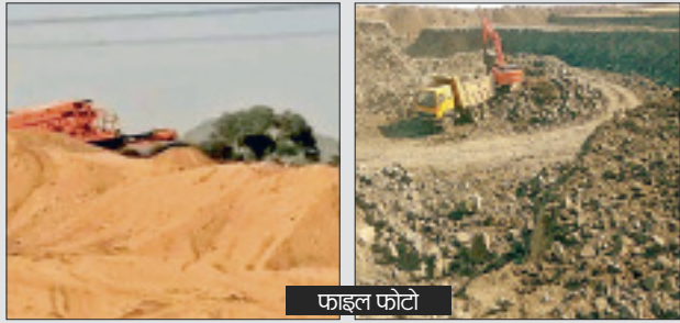
फाइल फोटो करीब 300 मुरुम-गिट्टी व ईट के प्रकरण जिले में रेत के साथ मुरुम, गिट्टी व ईट के अवैध परिवहन के मामलों में करीब 300 गाड़ियां पकड़ी हैं। इन गाड़ियों के मालिकों से भी जुमाना वसूला गया है।

विभाग ने धरसीवा, विधानसभा, माना, मंदिर हसीद, सिलियारी, तिल्ला, आरंग, खरोरा, मनुपुरी, उपरवार, राखी व अमनपुर क्षेत्र में जांच अभियान चलाकर इन प्रकरणों पर कार्रवाई की है। कई प्रकरणों में विभागीय टीम ने रात में गश्त कर गाड़ियों को पकड़ा है।